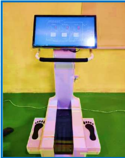
تھرمل فٹ سکنرز