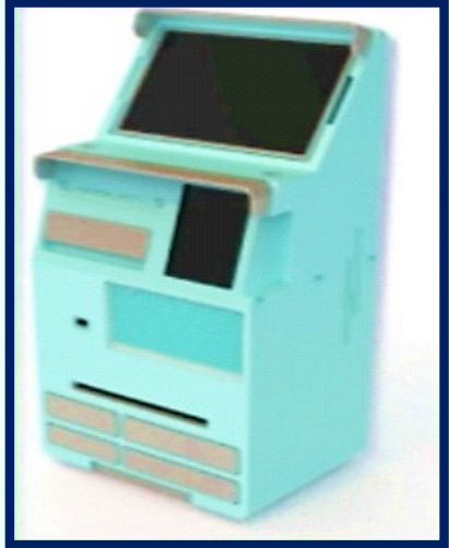
ബ്ലഡ് ടെസ്റ്റ് കിയോസ്ക്

സൗകര്യപ്രദവും താങ്ങാനാവുന്നതുമായ ഡയഗ്നോസ്റ്റിക് പരിഹാരം