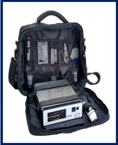
പോർട്ടബിൾ ക്യൂബ് ഡിവൈസ്