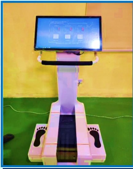
തെർമൽ മുട്ട് സ്കാനർ