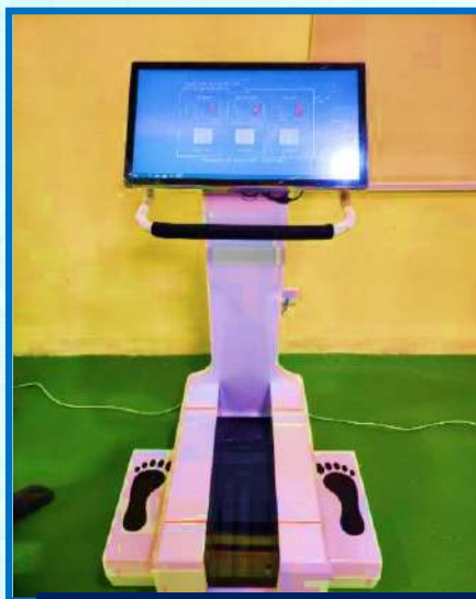
থাৰ্মেল ফুট স্কেনাৰ