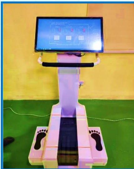
थर्मल फुट स्क्यानर