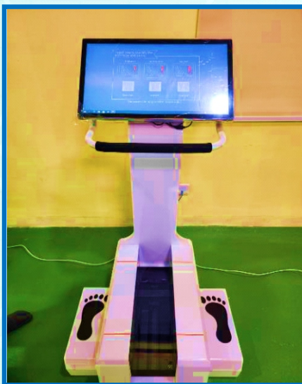
थर्मल फुट थर्मल